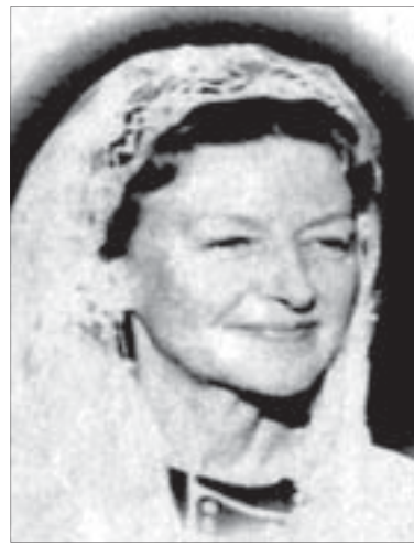
ماری (روحیه) ماکسول/همسر شوقی افندی رهبران شعبایون انگلیسی بهائیت

روحیه ماکسول (از رهبران بهائیت و همسر شوقی افندی) تصریح می کند: «من ترجیح می دهم که جوان ترین ادیان (بهائیت) از تازه ترین کشورهای جهان (اسرائیل) نشو و نما نماید و در حقیقت باید گفت آینده ما (بهائیت و اسرائیل) چون حلقات زنجیر به هم پیوسته است.»